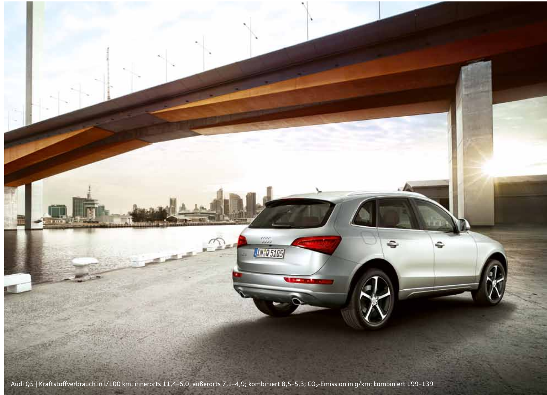
Audi Q5 | Kraftstoffverbrauch in l/100 km: innerorts 11,4–6,0; außerorts 7,1–4,9; kombiniert 8,5–5,3; CO 2 -Emission in g/km: kombiniert 199–139