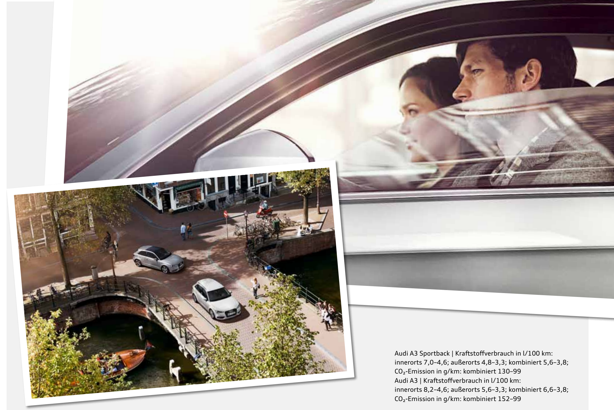
Audi A3 Sportback | Kraftstoffverbrauch in l/100 km: innerorts 7,0-4,6; außerorts 4,8-3,3; kombiniert 5,6-3,8; CO 2 -Emission in g/km: kombiniert 130-99 Audi A3 | Kraftstoffverbrauch in l/100 km: innerorts 8,2-4,6; außerorts 5,6-3,3; kombiniert 6,6-3,8; CO 2 -Emission in g/km: kombiniert 152-99