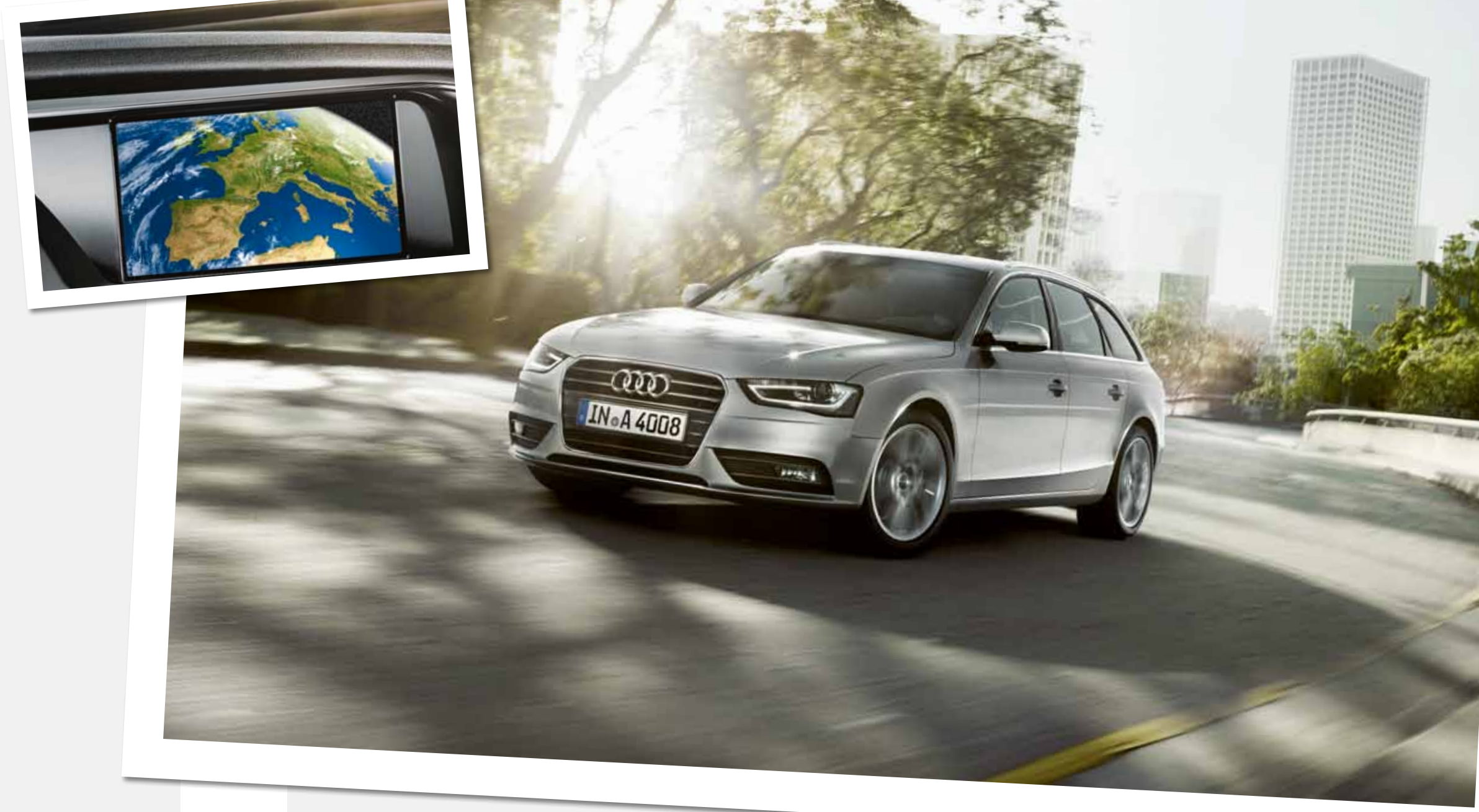
Audi A4 Avant | Kraftstoffverbrauch in l/100 km: innerorts 12,4–5,3; außerorts 7,9–3,9; kombiniert 9,5–4,4; CO 2 -Emission in g/km: kombiniert 197–116

Wir übernehmen die zentrale Implementierung Ihrer Flottenmanagementlösung und stellen durch unsere lokalen Ansprechpartner die reibungslose Umsetzung sicher. Unsere Mitarbeiter bieten während der gesamten Umsetzungsphase eine individuelle Betreuung vor Ort – ohne Sprachbarrieren.