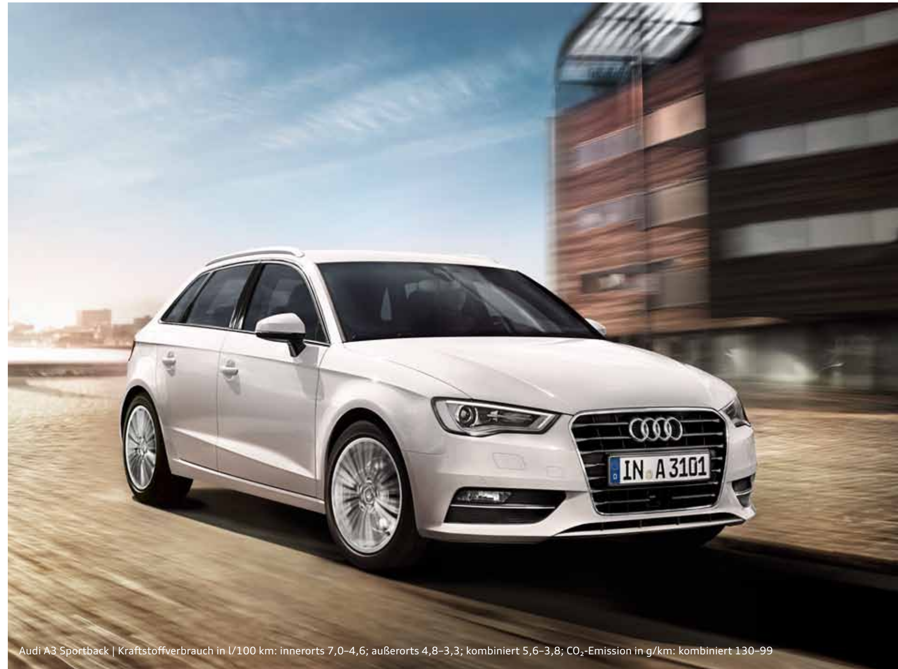
Audi A3 Sportback | Kraftstoffverbrauch in l/100 km: innerorts 7,0-4,6; außerorts 4,8-3,3; kombiniert 5,6-3,8; CO 2 -Emission in g/km: kombiniert 130-99