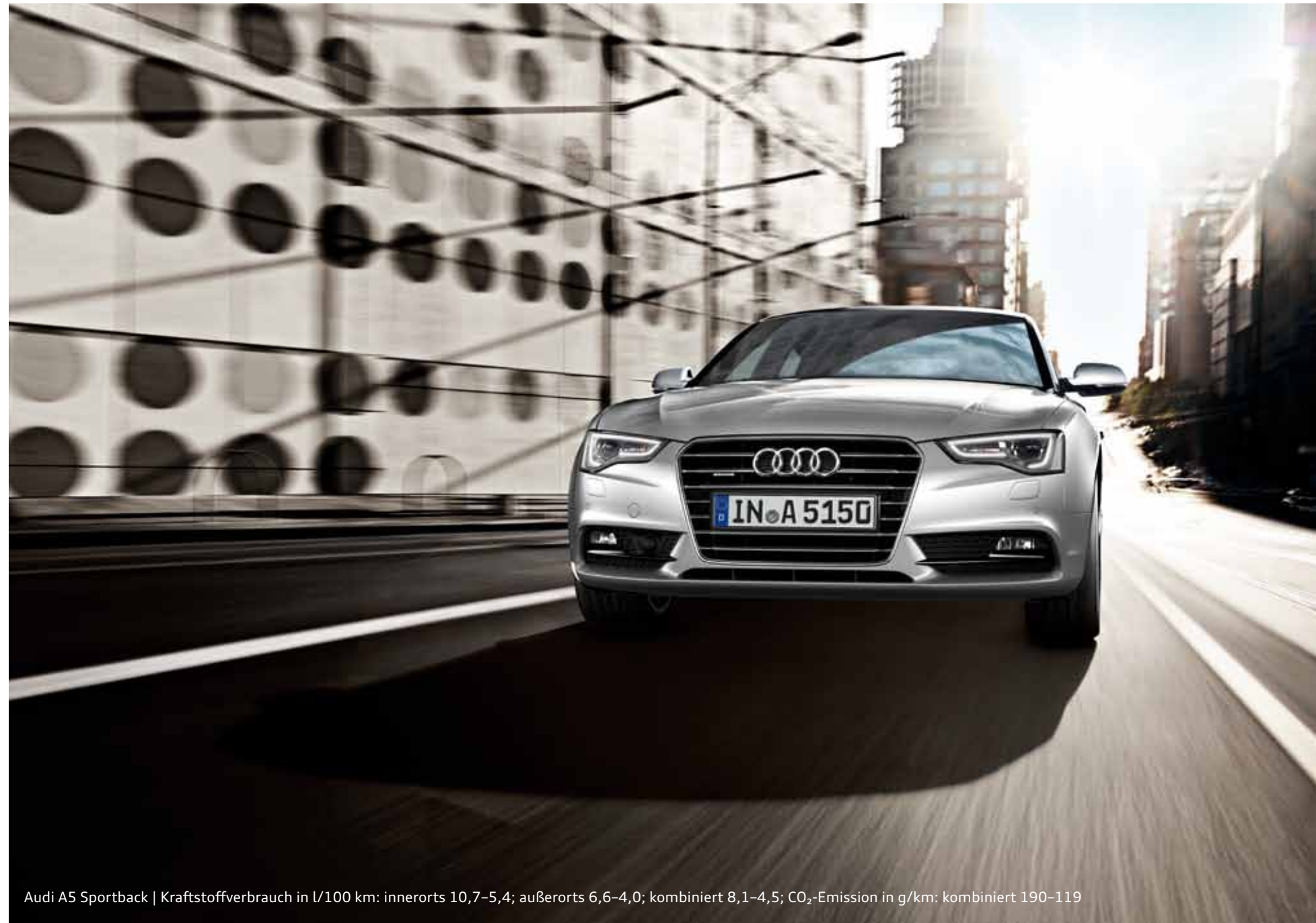
Audi A5 Sportback | Kraftstoffverbrauch in l/100 km: innerorts 10,7–5,4; außerorts 6,6–4,0; kombiniert 8,1–4,5; CO 2 -Emission in g/km: kombiniert 190–119