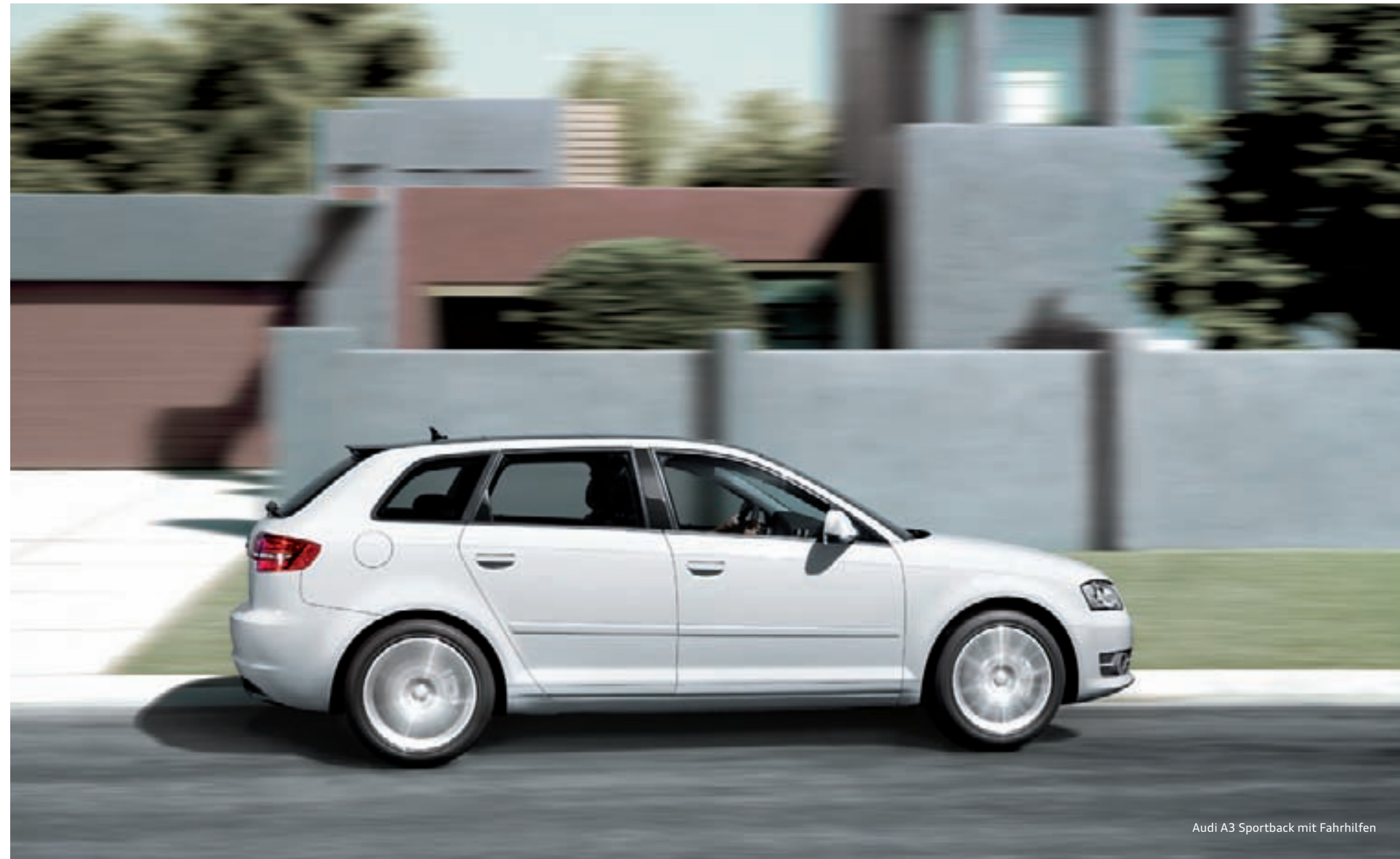
Audi A3 Sportback mit Fahrhilfen