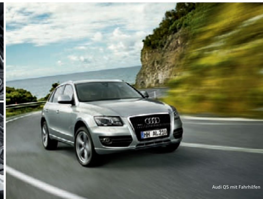
Audi Q5 mit Fahrhilfen

A3, A3 Sportback: Kraftstoffverbrauch in l/100 km: innerorts 4,5–10,0; außerorts 3,3–6,2; kombiniert 3,8–7,6; CO 2 -Emission in g/km: kombiniert 99–176