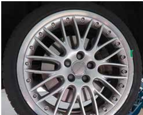
Bremsscheibe in Ordnung