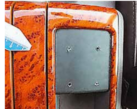
Bohrlöcher im Verkleidungsteil