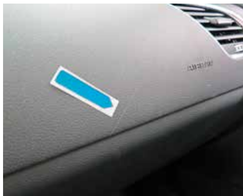
Geringfügige Beschädigung der Kunststoffverkleidung