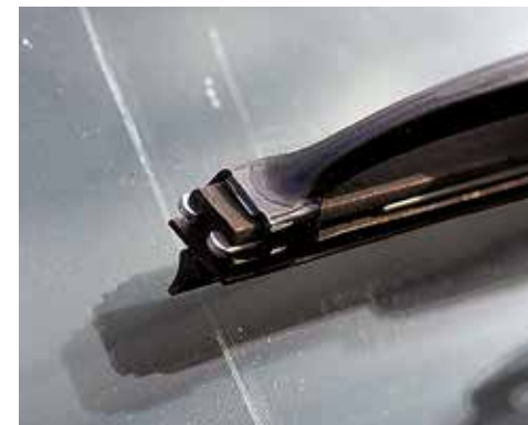
Kratzer > 10 mm