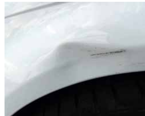
Deformation > 20 mm