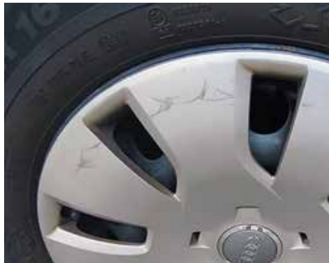
Leichte Kratzer an Radkappe