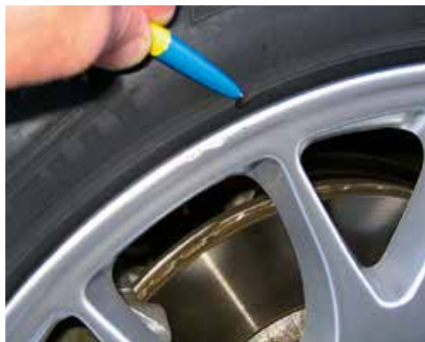
Leichte Materialabtragung an der Scheuerleiste