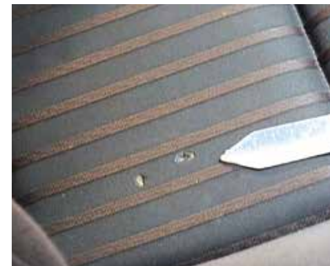
Brandloch im Sitzbezug