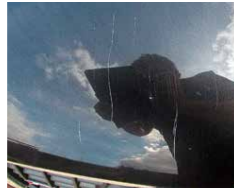
Beschädigung des Basislacks