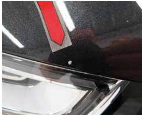
Steinschlag \leq 2 mm