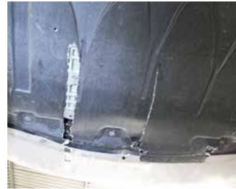
Beschädigung der Unterbodenverkleidung