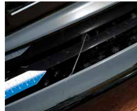
Lackschäden am Stoßfänger