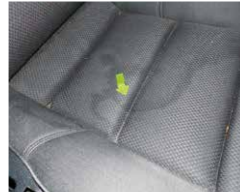
Starke Verschmutzung der Polsterung