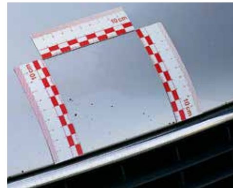
Mehr als fünf Steinschläge pro 10 \times 10 cm