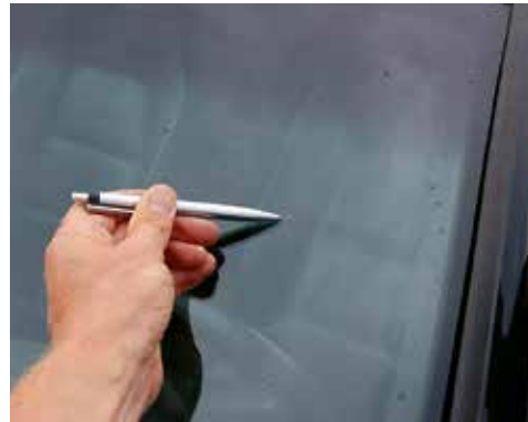
Steinschlag < 2 mm