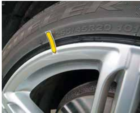
Leichte Kratzer ohne Materialabtragung