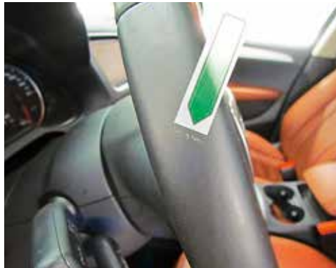
Leichte Kratzer am Lenkrad