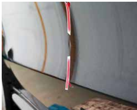
Delle < 20 mm