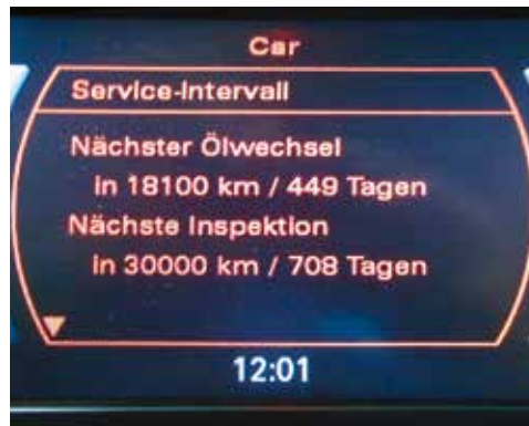
Service > 1.000 km