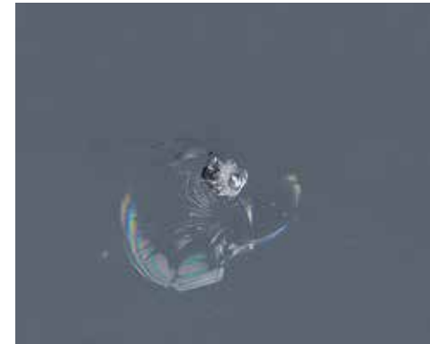
Steinschlag > 2 mm