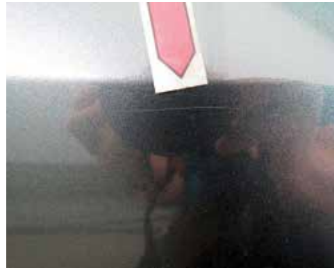
Kratzer in der Lackoberfläche