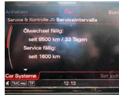
Service < 1.000 km/fällig