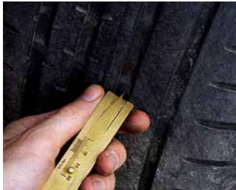
Sommerreifen > 2 mm