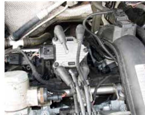
Beschädigung durch Nagetiere