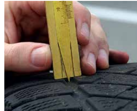
Winterreifen < 4 mm