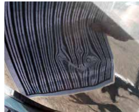
Drei Dellen an einem Karosserieteil