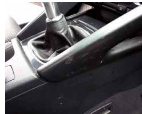
Starke Kratzer und Abschürfungen